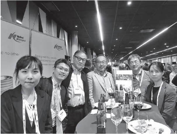
写真3：Welcome receptionの様子。北海道大学，広島大学および高知大学からの参加者。

ments of oral conditions (effects, risks, side effects)のセッションとして2つの演題が発表された。これらの発表とともに，下記に示す日本からの5演題を含む93演題のポスター発表も行われた（写真4）。