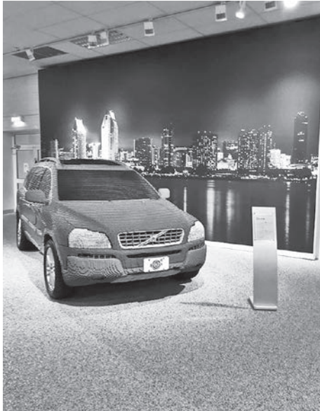
写真5：ボルボ博物館

tive impairment caused by autoimmune encephalitis. Fukushima Y, Isozaki Y, Endo M, Kitamura T, Kawata Y, Sato T (埼玉医科大学)