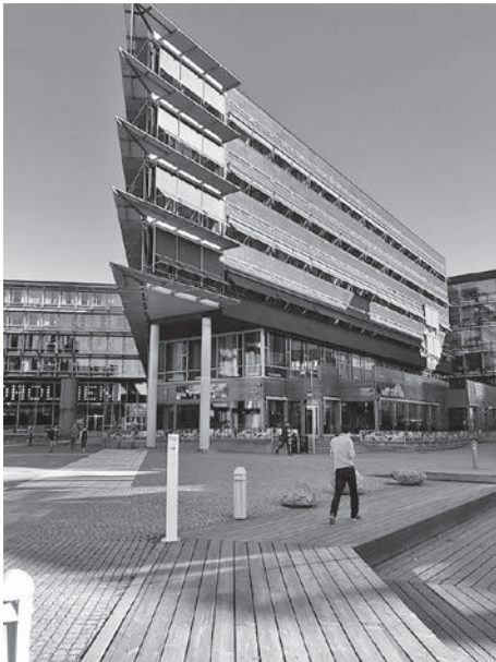
写真1：学会場であるLindholmen Science Center。三角形の建物の左奥が学会場