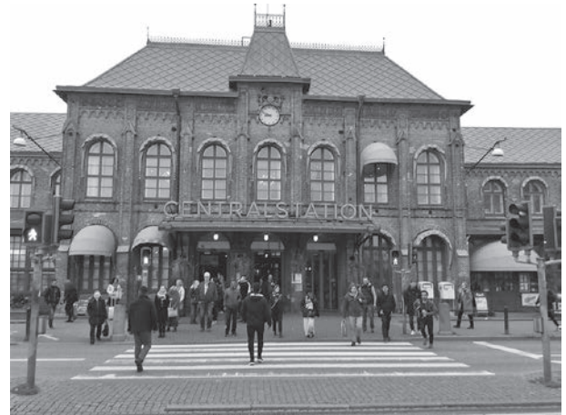
写真6：ヨーテボリ中央駅

大会最後に、次回の大会で、2020年9月17日から19日にかけてポルトガルの北部の港湾都市であるポルトで開